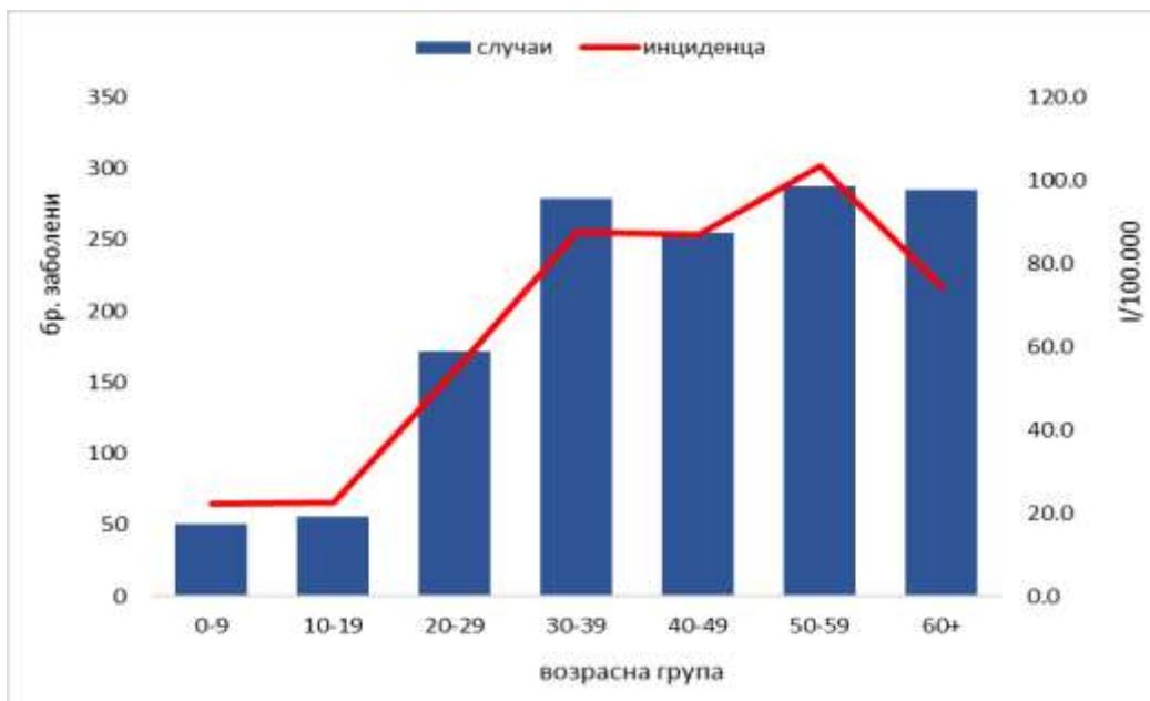
Графикон 1. Дистрибуција на заболениите од COVID-19 според возрастна група, (n=1.386)

Во однос на датумот на пријавување, првиот случај е регистриран во 9-та недела, а од 11-тата недела во 2020 континуирано се регистрираат нови потврдени случаи. Највисок број на пријавени случаи на дневно ниво (n=107) е регистриран на 15.04.2020 (Графикон 2).