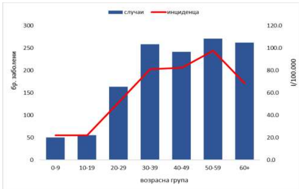
Графикон 1. Дистрибуција на заболените од COVID-19 според возрастна група, (n=1.300)

Во однос на датумот на пријавување, првиот случај е регистриран во 9-та недела, а од 11-тата недела во 2020 континуирано се регистрираат нови потврдени случаи. Највисок број на пријавени случаи на дневно ниво (n=107) е регистриран на 15.04.2020 (Графикон 2).